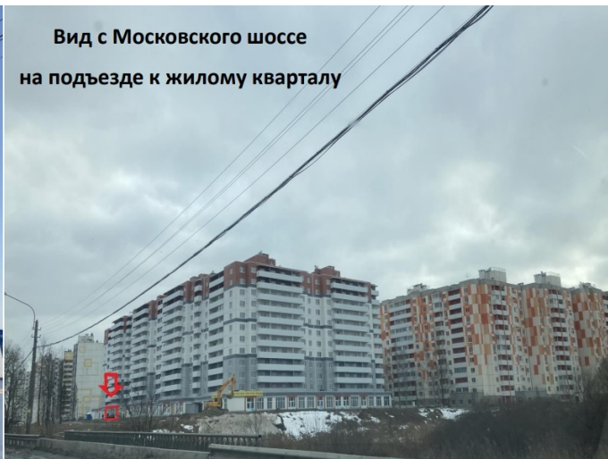
Вид с Московского шоссе на подъезде к жилому кварталу