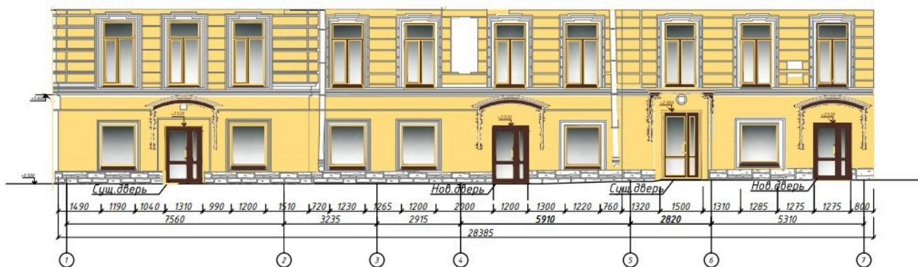
Фасад (фрагмент) в осях А/1-7 М 1:100