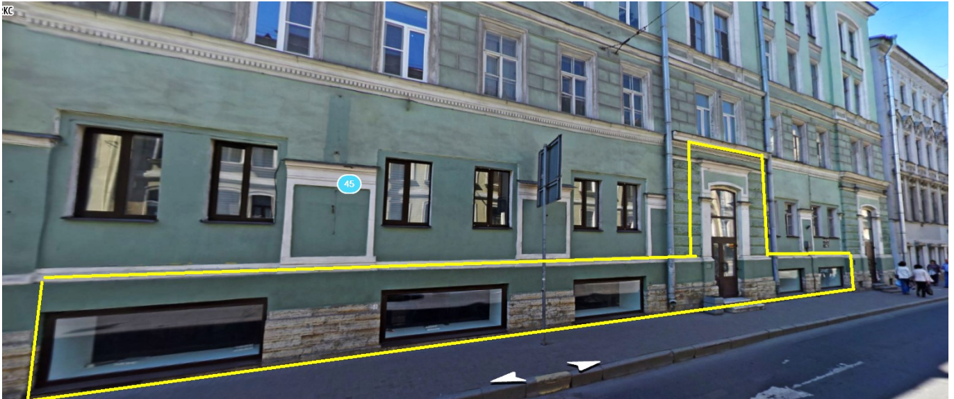
План цокольного этажа